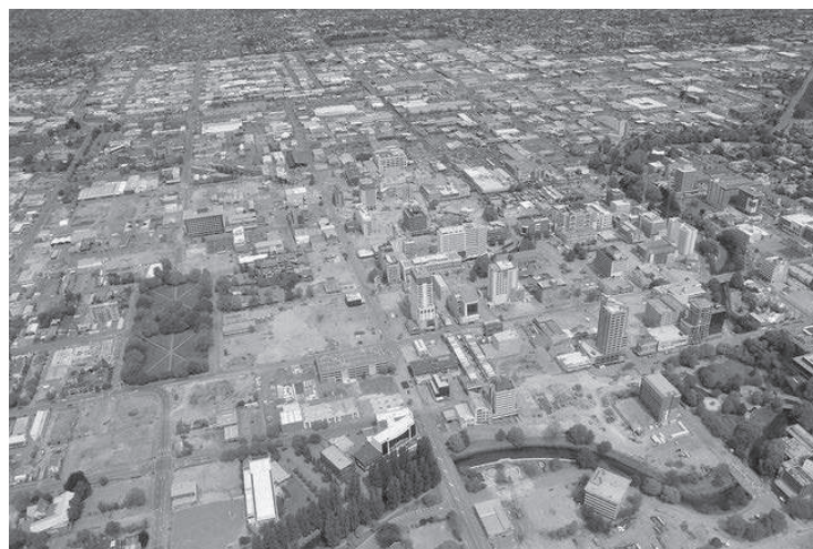
写真2 地震後のクライストチャーチ