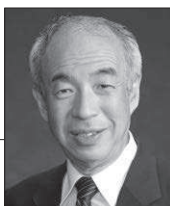
日本免震構造協会 会長 東京工業大学 名誉教授